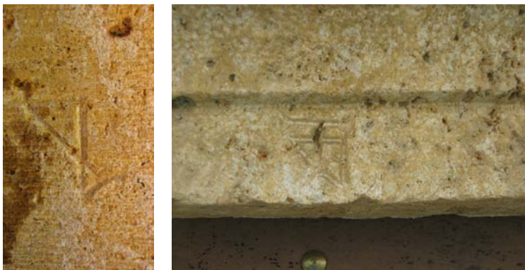
Kamnoseška znamenja s cerkve na sv. Primožu.