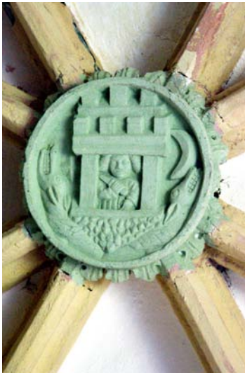
Najstarejši kamniški grb na sklepniku v cerkvi svetega Primoža, okoli 1470.

Z grbovno ploščo se je mesto Kamnik po izdaji cesarskega privilegija leta 1489 želelo zahvaliti cesarski vladarski hiši, ki je potrdila privilegij svobodnih volitev sodnikov (županov). Na tej grbovni plošči je ohranjen drugi najstarejši kamniti kamniški grb iz okoli leta 1490, nekoliko starejši pa je ohranjen na sklepniku v cerkvi sv. Primoža. Na njem je upodobljena sv. Marjeta kot zaščitnica mesta Kamnik.